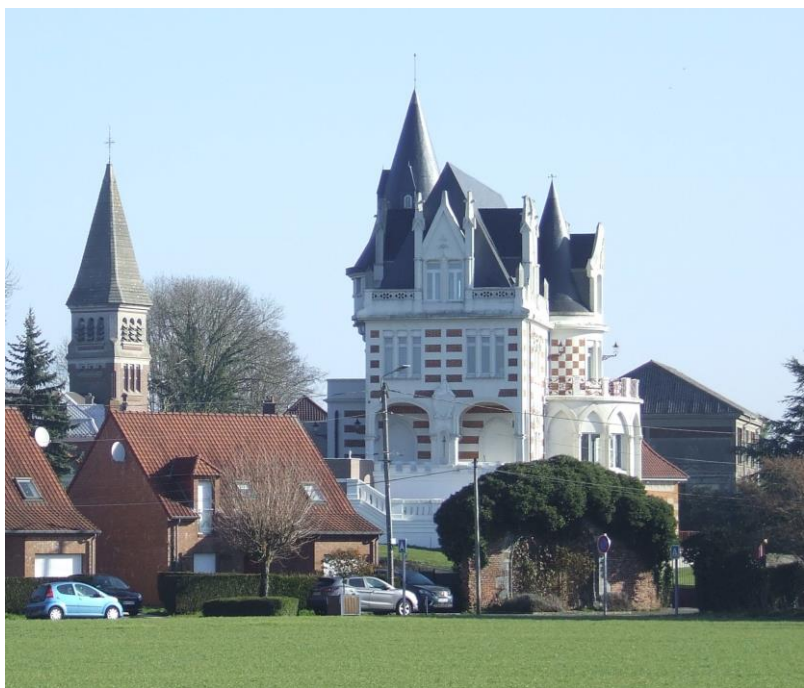
Ci-dessus : photo d'Etienne Emaille, le 28 février