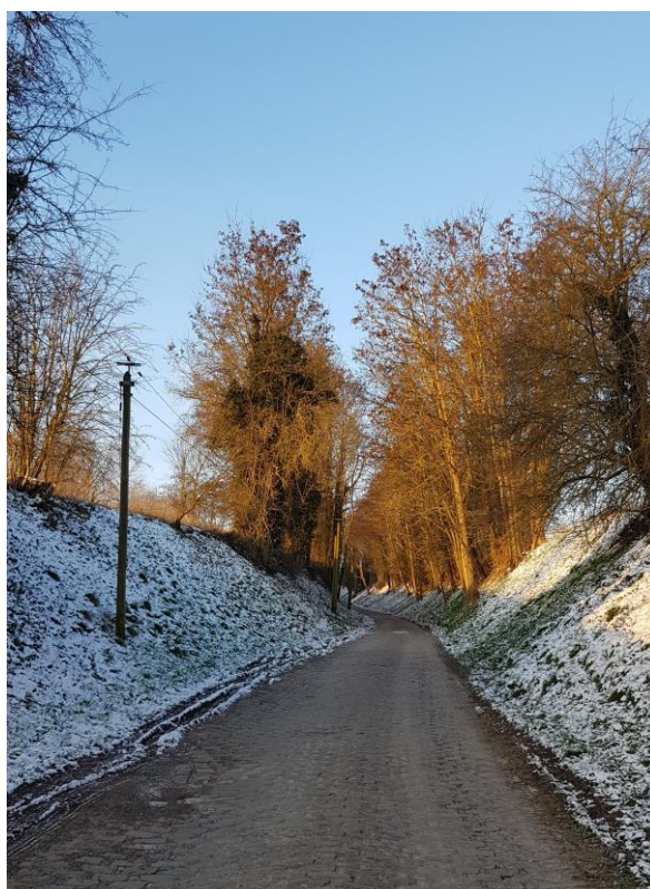
La cavée sous la neige – photo de Jacques Charpentier