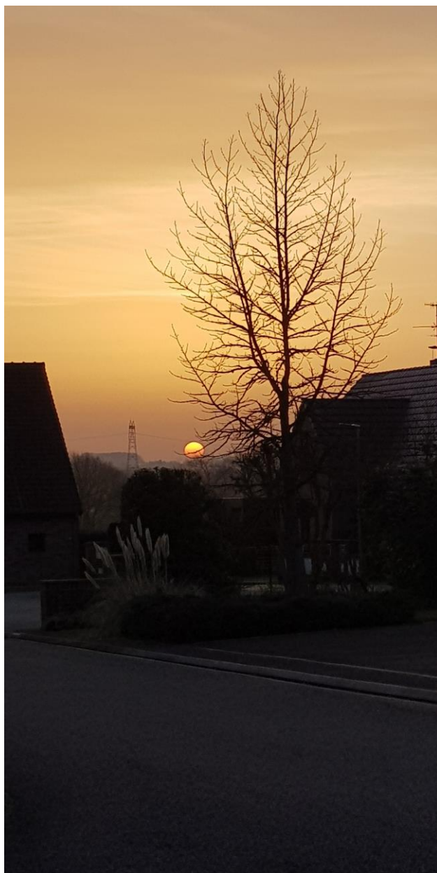
Ci-dessus : lever de soleil fantomatique allée Pierre- Victor Dautel. le 25 février