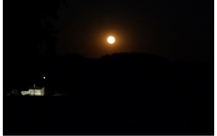
Lever du jour avant la canicule (JB Mehaut 12/07) ; Pêcheur sarrasin au bord de la Rhonelle (J. Charpentier 21/08) Rapace sur une meule de paille (J. Charpentier 30/07) ; Lune rousse au-dessus de la Tranquillité (H. Maillard 12/08)