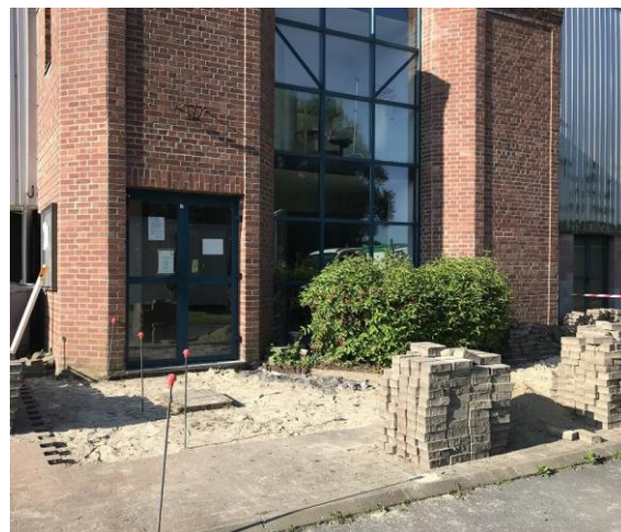
Mise aux normes PMR de l'entrée. Avant remplacement de la porte et du contrôle d'accès.