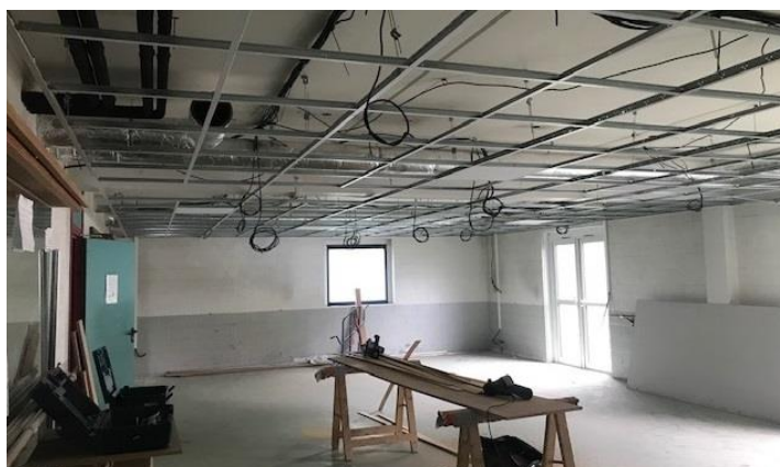
La salle de danse en travaux (ventilation, chauffage, électricité et faux plafond)