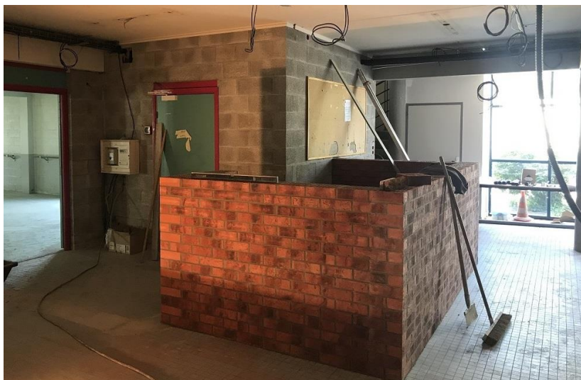
Le hall est réaménagé, pour gagner en espace et en convivialité

Je vous souhaite à toutes et à tous un bel été et de bonnes vacances.