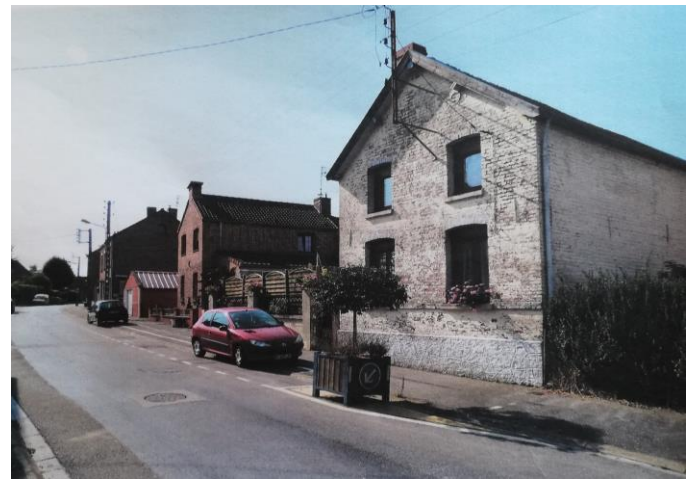
En 2022...