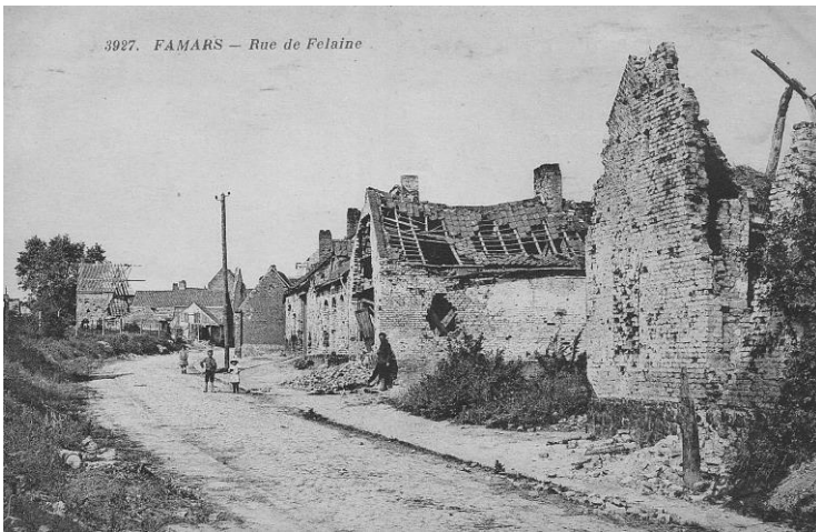
En 1919, après la 1 ère Guerre Mondiale